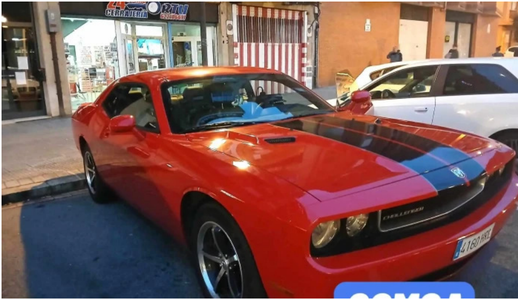
Copia de llaves de coche del propietario