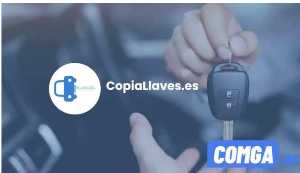
Copia de llaves de coche bilbao